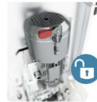
Noodontgrendeling zonder gereedschap