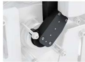
Zeer precieze absolute encoder